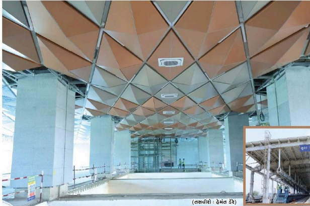
(તસવીર - દેખેત ડે)

બુલેટ ટ્રેન સ્ટેશનના બાજુ માને પેટરોમ છે. અહીં ટ્રેન ચલે છે. જેનું કામ પૂર્ણ થઈ ચૂક્યું છે. વચ્ચે બે ટ્રેક અને આજુ બાજુમાં એક એક ટ્રેક છે. ડાબી ડોનેરના ટ્રેક પર અમદાવાદ તરફ જતી અને જમણી... ...અનુસંધાન પાના 9 પર